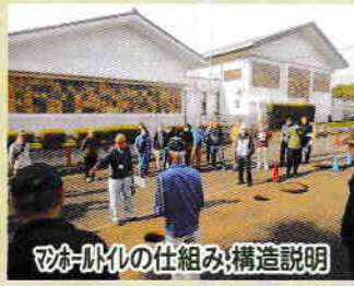
マンホールの仕組み、構造説明