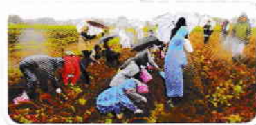
わいわい芋ほり まつり(10月)