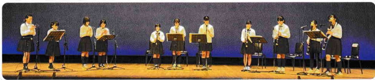
中丸小学校リコー ター部員演奏