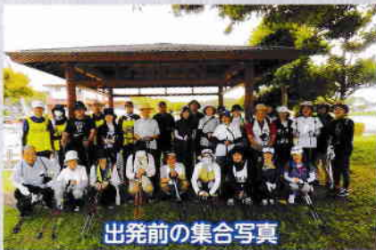
出発前の集合写真