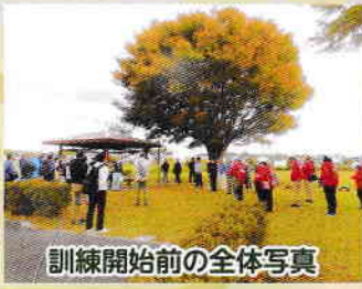
訓練開始前の全体写真