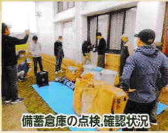
備蓄倉庫の点検、確認状況