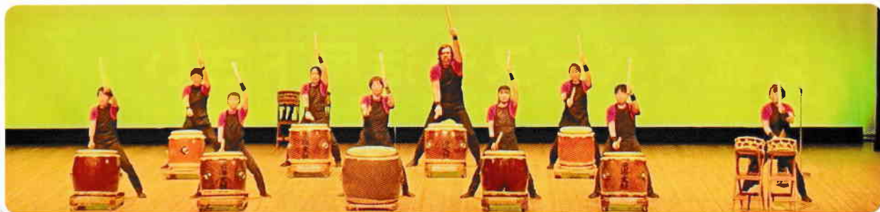
東海和太鼓保存会 演奏