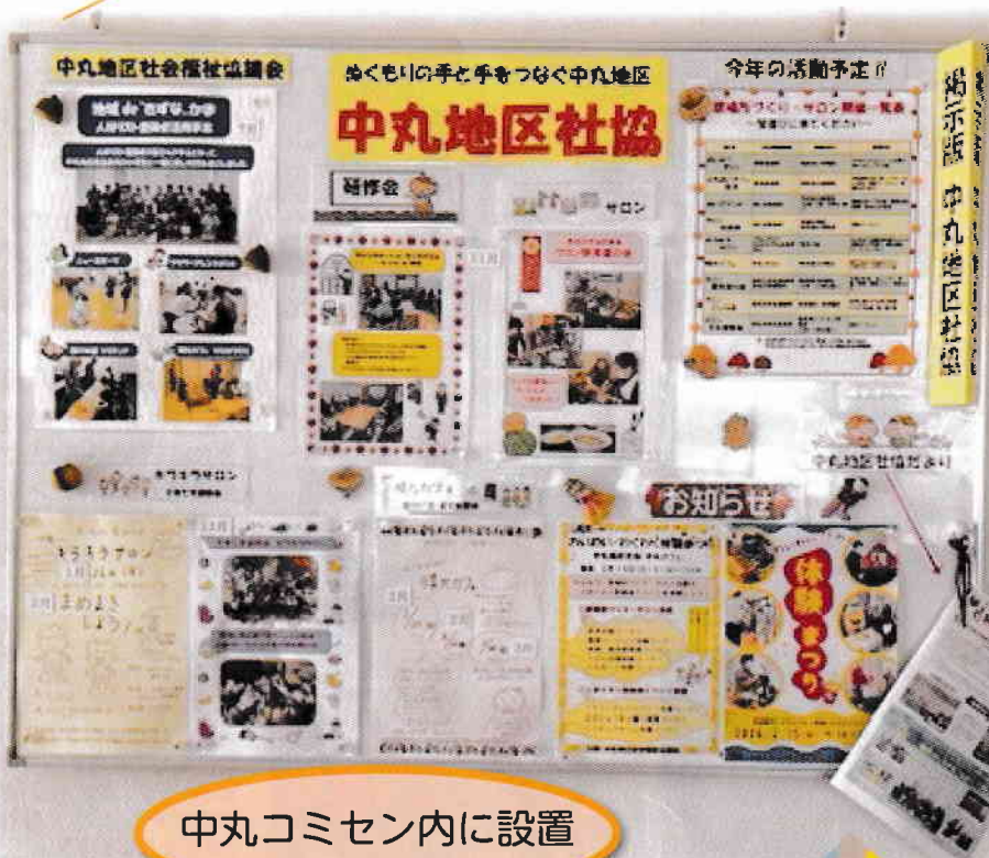
中丸コミセン内に設置