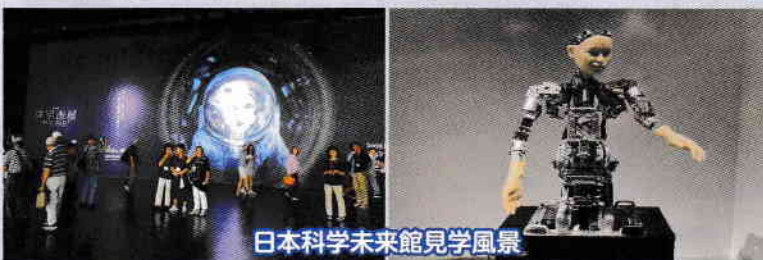
日本科学未来館見学風景