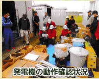
発電機の動作確認状況