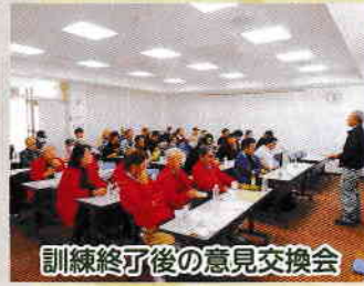
訓練終了後の意見交換会