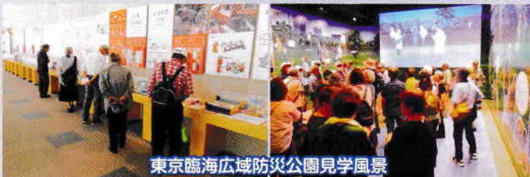
東京臨海広域防災公園見学風景