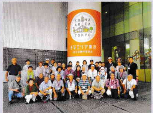
集合写真 (東京臨海広域防災公園にて)