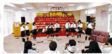
中丸コミセンひ なまつり(3月)