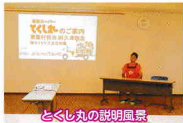
とくし丸の説明風景