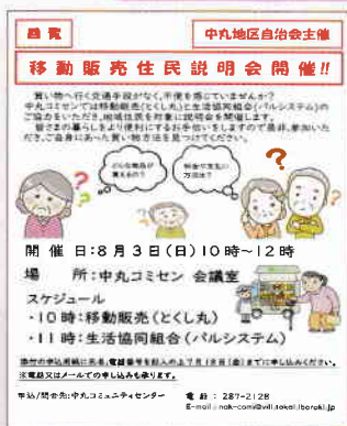
移動販売説明会 開催案内チラシ