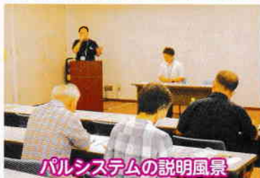
パルシステムの説明風景